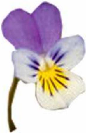
« Violette » - Donnant lieu à la foire de s Violettes de Ste Eulalie

Or 10€ with main course + cheese or dessert