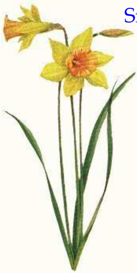
Pat Morris, "Toute la nature", Bordas

Small platter of local cold pork and ham cuts