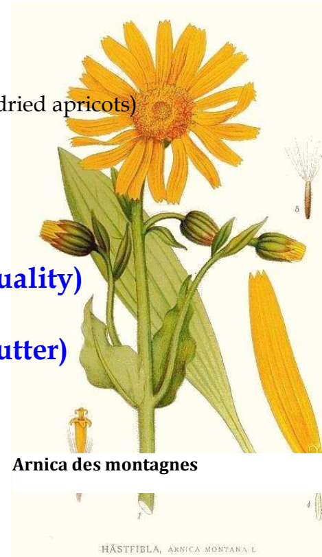
Arnica des montagnes