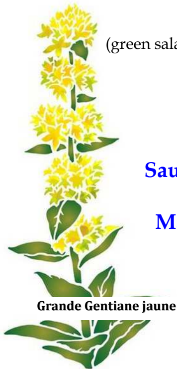
Grande Gentiane jaune